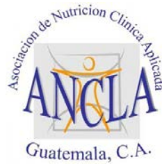
Asociación de Nutrición Clínica Aplicada - ANCLA Guatemala, C.A.