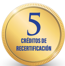
Colegio de Profesionales en Nutrición de Costa Rica - CPNCR