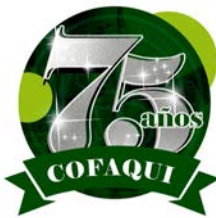
Colegio de Farmacéuticos y Químicos de Guatemala - COFAQUI