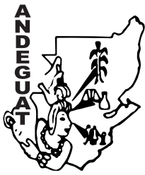
Asociación de Nutricionistas de Guatemala - ANDEGUAT